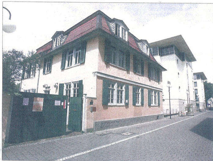
Gravierende Schäden wurden an der Fachwerkkonstruktion des Pfarrhauses der Französisch-Reformierten Gemeinde in der Herrnstraße 55 festgestellt.