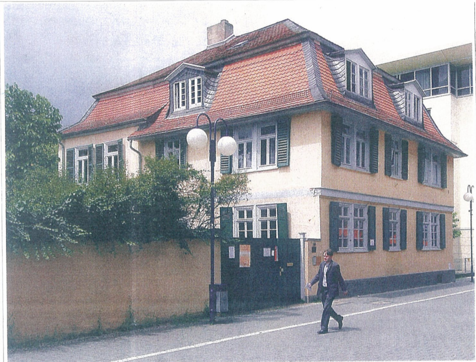
Das sanierungsbedürftige Haus der Französisch-Reformierten Gemeinde an der Herrnstraße

Die französischen Wurzeln sind heute nicht mehr sichtbar. Geblieben sind eine Sonderstellung innerhalb der protestantischen Glaubenswelt und eine selbstbewusste Traditionspflege. Anderswo mag es in Vergessenheit geraten sein, aber an der Herrnstraße weiß man noch, was die aus Frankreich eingewanderten Gründer für die Stadt bedeuteten.